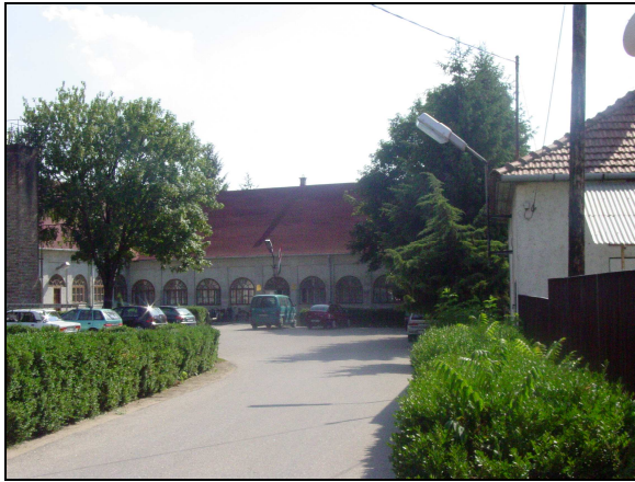
A Zichy kúria épülete,

Kiemelkedő építészeti örökség a XVIII-XIX. század fordulóján épült kúria, mely a gr. Zichy család lakóháza volt. A kúria napjainkban a polgármesteri hivatalnak és a művelődési háznak ad helyet. A településképet jelentősen meghatározó U alakú udvarház a késő barokk stílusjegyeit viseli magán.