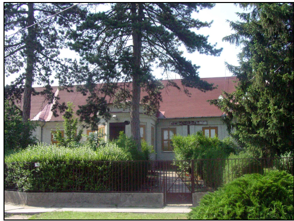
és Művelődési ház

Az egykori udvarán áll a XIX. század elején népi barokk stílusban épült emeletes terménytároló, a magtár. Az épület állaga felújítást igényel, jelenleg DISCO működik benne.