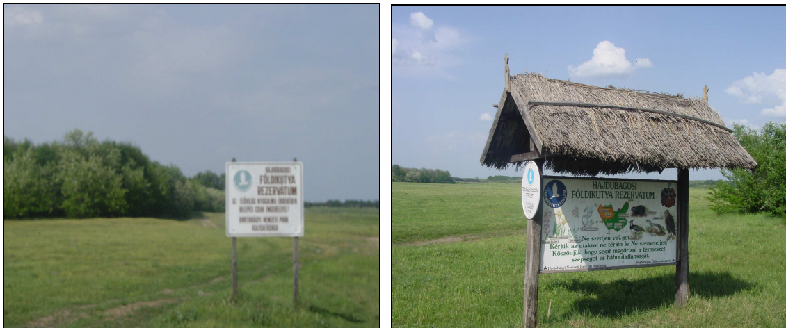
A földikutya rezervátum területe

Hajdúbagoson jelentős terület tartozik a Hajdúsági Tájvédelmi Körzethez. Számos védett állat- és növényfaj található itt, köztük a Magyarországon szinte egyedülálló, fokozottan védett 250 hektárnyi Földikutya Rezervátum. A rezervátum a kihalófélben lévő állatfaj utolsó magyarországi élőhelye. Ez az ösgyep ad otthont még több, mint 90 állatfajnak és mintegy 130 növényfajnak, melyből több is védelem alatt áll.