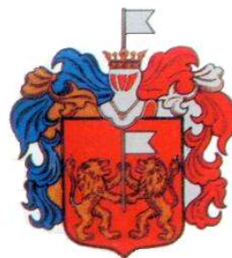
Hajdúbagos község címere

Hajdúbagos Község Önkormányzata 4273 Hajdúbagos Nagy u. 101. Telefon: 52/567-212 Fax: 52/374-018