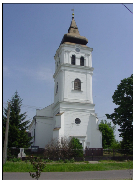
A református templom

A természeti értékek mellett építészeti, művi örökségekkel is rendelkezik a község, amely elrendezését tekintve tipikusan soros település. A fő utcája az egykori Váradot Tokajjal összekötő út mentén alakult ki. Ez az út a község központjában egykor térré szélesedett ki, ahol ma is áll a település egyetlen temploma, a református templom. A templom eredete 1488-ra tehető vissza, amelyet a XV. század óta többször is átépítettek.