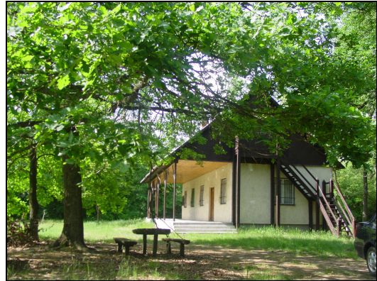
A hajdúbagosi pihenőház

A település kulturális életében meghatározó a minden nyáron megrendezésre kerülő alkotótábor, melyet a település határában fekvő erdő pihenőházában tartanak.