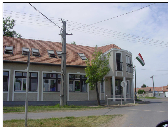
Sinaï Miklós Általános Iskola