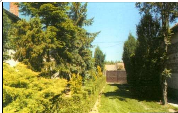
Szabó Károly védett kertje

A természeti értékek között említést kell tennünk Szabó Károly fafaragó népművész védett kertjéről, mely a község központjában, a Templom u. 2. szám alatt található. A kertben mintegy 40 fenyőféléseleg található, például a szürkés-kék oregoni hamisciprus, az aranyos oszlopos tiszafa. A kert kapcsán sokat emlegetik a megyében, egyedülálló mamutfenyő kisméretű példányát. A kert különlegességei közé tartozik a lila virágú magnólia, valamint az illatos császárfa.