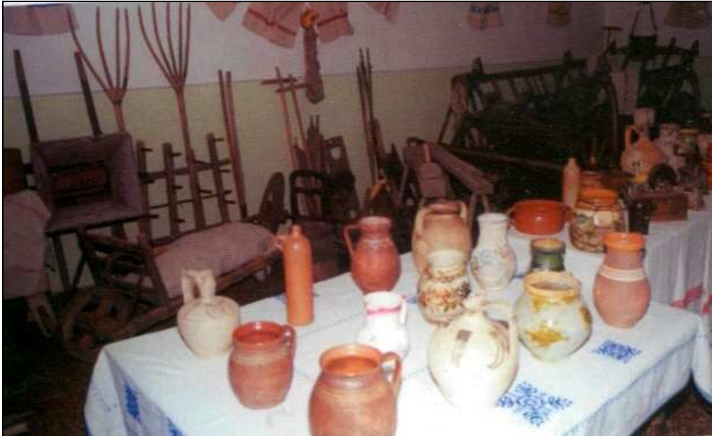
A helytörténeti kiállításon bemutatott tárgyak

A Bocskai utca 17. szám alatti iskolában tekinthető meg a község állandó helytörténeti és néprajzi kiállítása, bemutatva a hagyományos paraszti élet eszközeit.