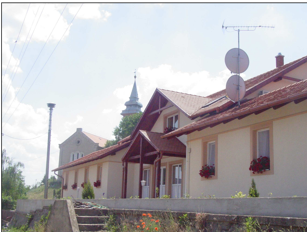
A bagaméri református idősek otthona