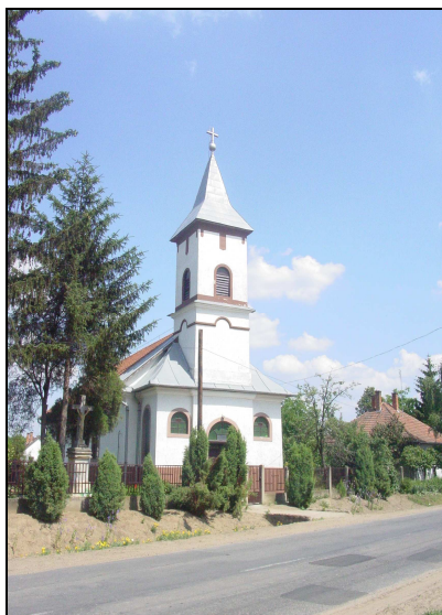
Görög katolikus templom

A község másik temploma – a görög katolikus templom – a Rákóczi utcán található, melyet 1852-54. között építettek újjá.