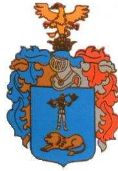
Bagamér község címere

Bagamér Nagyközség Önkormányzata 4286 Bagamér, Kossuth u.7. Telefon/fax: 52/587-400