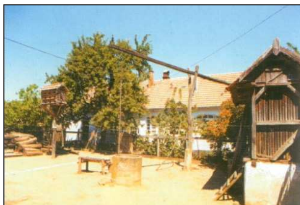
Hagyományos bagaméri parasztporta

Műemlékvédelemre érdemesek a népi építészet remekeiként az eredeti formájukban álló parasztporták, melyek az Árpád, a Bocskai és a Csokonai utcákban állnak.