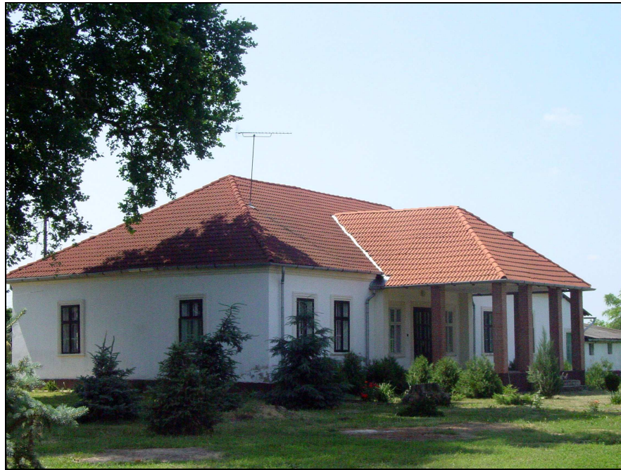
Felújított nemesi kúria