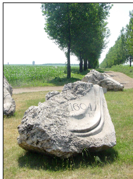
Az álmosdi csata emlékműve a község határában

Az 1604. október 15-én Bocskai István fejedelem vezetésével a hajdúk által megvívott győztes álmosdi csatának a község két emlékművet is felállíttatott. Az egyik emlékmű – Nagy Sándor alkotása – a főtéren áll, a másik 1996. október 15-én felavatott monumentális emlékmű a község határában áll, melyet Győrfi Lajos szobrászművész készített.