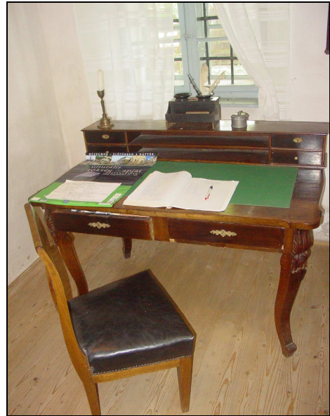
Kölcsey Ferenc emlékmúzeum, a Kölcsey család egykori lakóháza