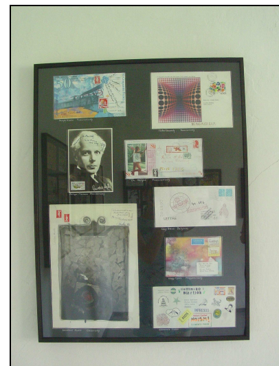
Részlet a Post-Mail art Múzeum gyűjteményéből