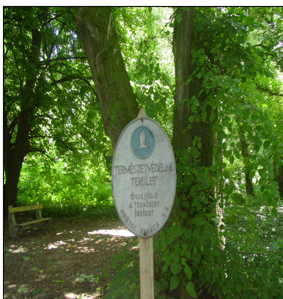
Miskolczi kúria parkja a vadgesztenyefával