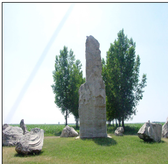
Az 1604-es álmosdi csata emlékmve

Az 1552. évi összeírás szerint Álmosd 23 adózó portával népes településnek számított. A falut birtokló Chyre család kihaltával, Tahy Ferenc, majd Dobó István birtoka lett a község.