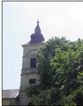
A református templom

Álmosd 2 templommal is büszkélkedhet. A XIII-XIV. századi református templom mai formáját az 1805-ös, illetve 1822-24. közötti átépítések után nyerte el. A XIV. századi téglatemplom maradványai a mai templom alatt fellelhetők. A templomot több száz éves kőfal öleli körül, mely különleges látványt nyújt a település központjában álló épületnek.