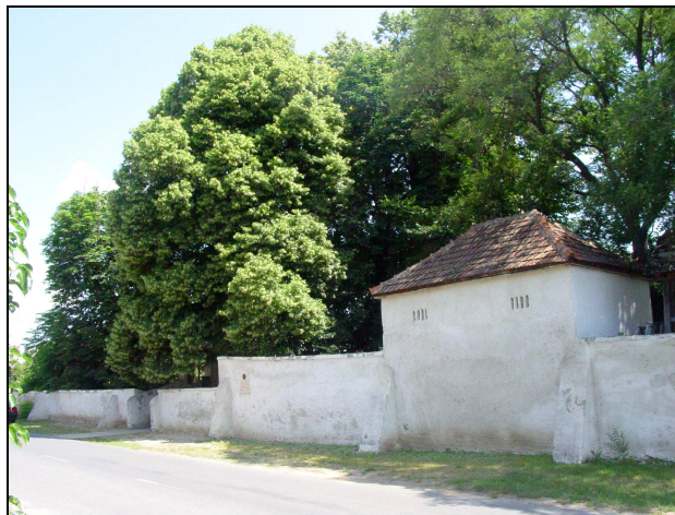
Református templomot körülvevő kőfal

A tatárjárásban elpusztultak Álmosd birtokosainak papírjai, ezért fordulhat elő, hogy írásos emlékek csak viszonylag későn említik. A település híres építésze-ti öröksége az eredetileg XIV. századból származó téglatemplom maradványai. A Chyre Zsigmond által építtetett templomot 1805-ben bővítették, majd 1822. körül átépítették. Az egykori templom maradványai a mai református templom alatt találhatóak. A korabeli templomot és kertjét vastag kőfállal vették körül, amely máig megmaradt.