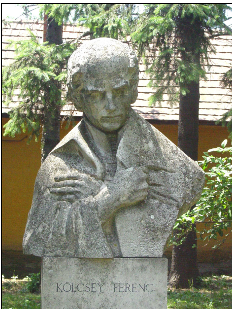
Kölcsey Ferenc mellszobra a múzeum udvarán