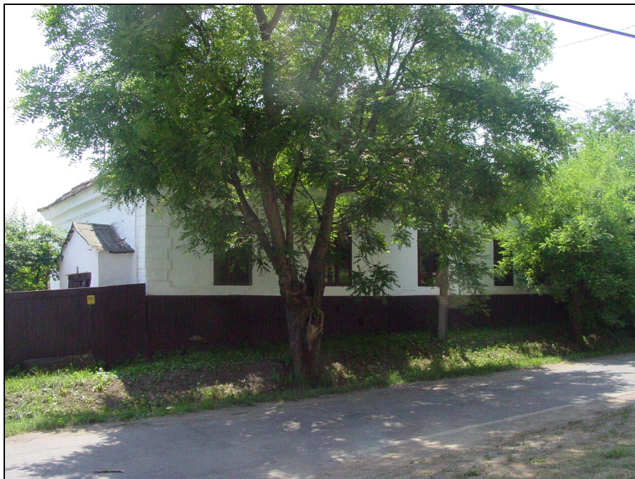
XIX. sz. eleji ház (Kölcsey Múzeummal szemben)